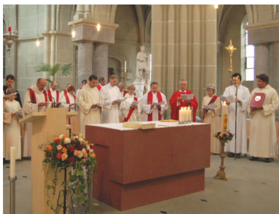
Der Altarraum in Bern