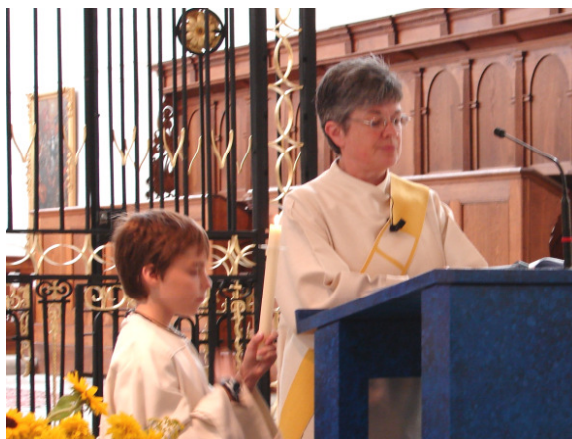
Die Diakonin verkündet das Evangelium

griechisch / dt: diakonos / Gehilfe, Diener.